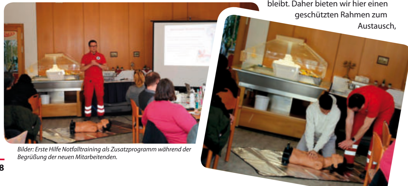
Bilder: Erste Hilfe Notfalltraining als Zusatzprogramm während der Begrüßung der neuen Mitarbeitenden.

Weitere Inhalte am Tag des Neuen Mitarbeiters sind die Themen Ausbildung, Belegungsmanagement, Qualitätsmanagement und Fehlerkultur. Wir wollen so viele offene Fragen wie möglich beantworten, da wir wissen, dass im Alltag auch gerne mal die ein oder andere Frage unbeantwortet bleibt. Daher bieten wir hier einen geschützten Rahmen zum Austausch,