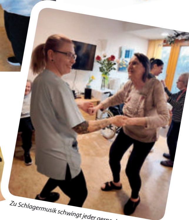
Zu Schlagermusik schwingt jeder gerne das Tanzbein.