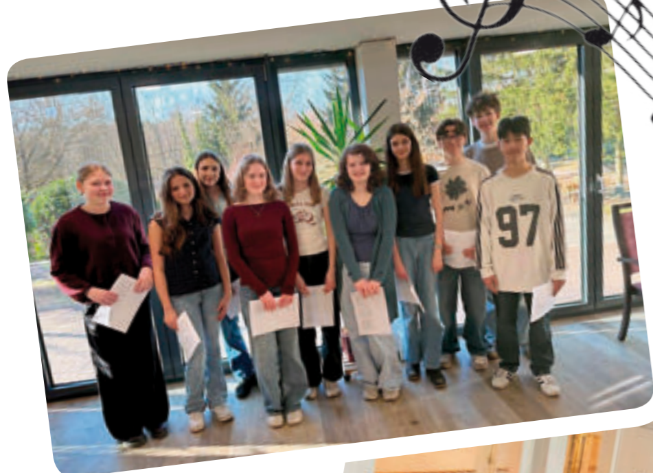
Foto oben: Die Schülerinnen und Schüler der Arbeitsgemeinschaft vom Archenhold-Gymnasium.