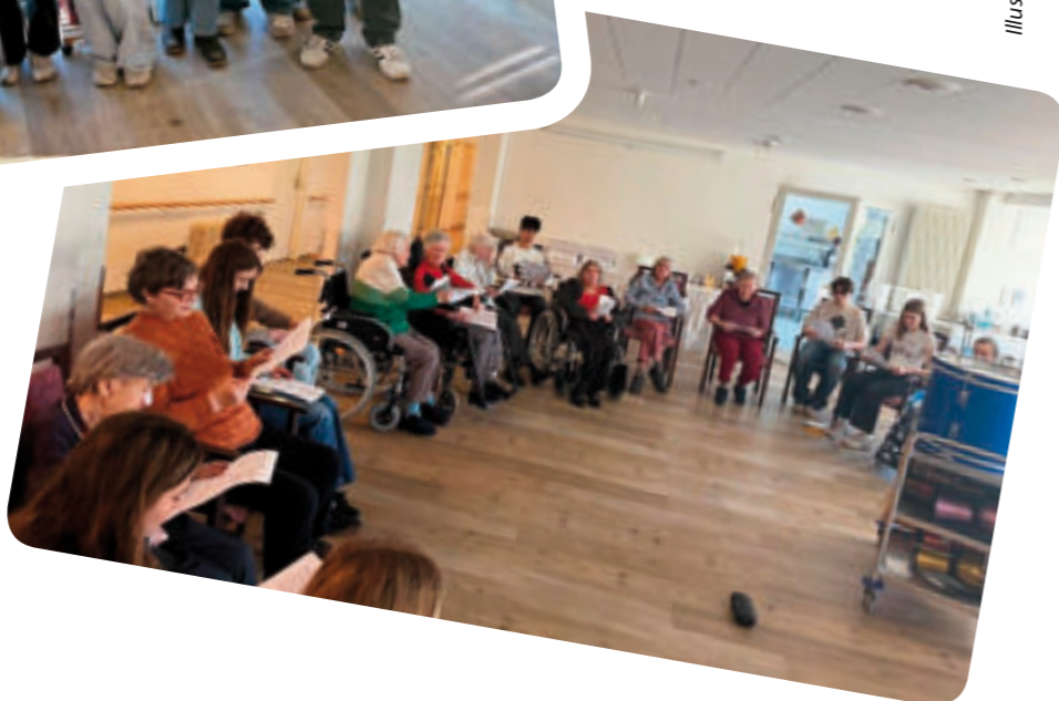
Foto rechts: Gemeinsames Singen und Musizieren an einem Dienstagnachmittag im Gemeinschaftsraum der Südostallee.