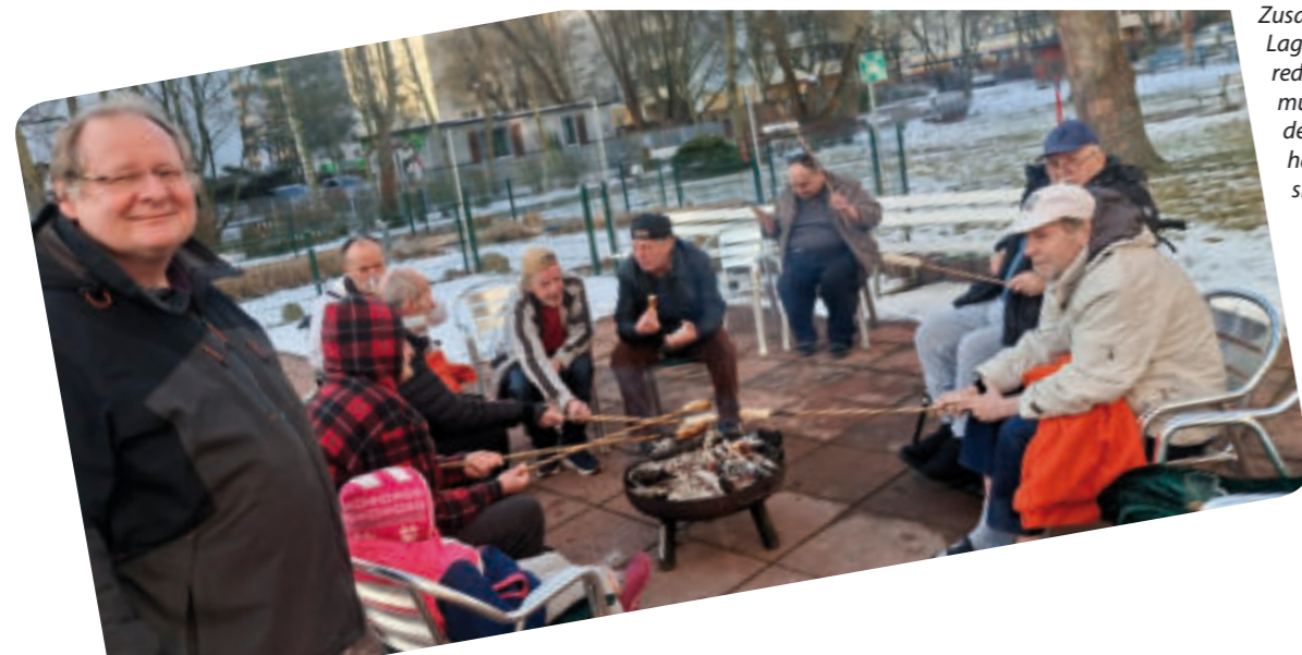
Zusammen am Lagerfeuer grillen, reden und Rockmusik hören stärkt den Zusammenhalt und macht sichtlich Freude.