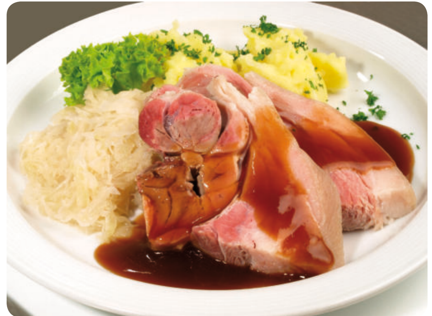
Lieblingssessen vieler unserer Bewohnerinnen und Bewohner: saftig-deftiges Eisbein.