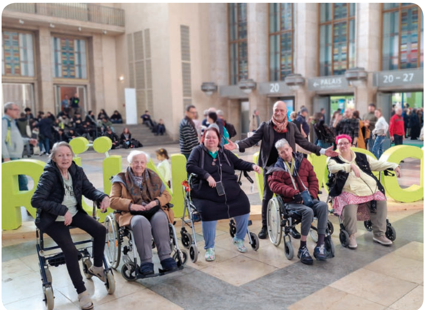
Alle sind bereit für den Messe-Marathon durch die Hallen

Zwischendurch stärkten wir uns mit dänischem Softeis, oben drauf kam drei Hallen weiter noch eine polnische Bratwurst – beides zum ‚Freundschaftspreis‘ von jeweils fünf Euro.