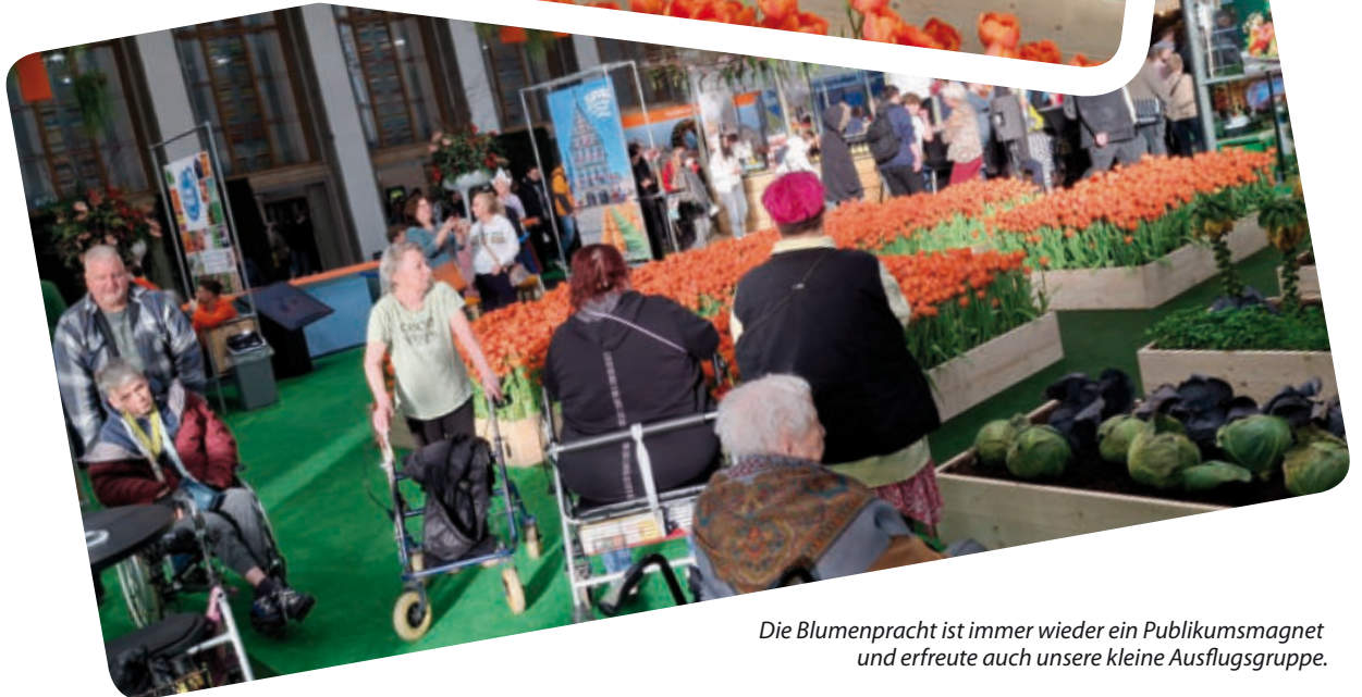
Die Blumenpracht ist immer wieder ein Publikumsmagnet und erfreute auch unsere kleine Ausflugsgruppe.