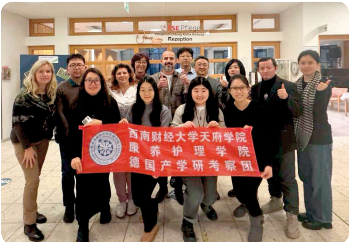
Die chinesischen Gäste mit einer Fahne ihrer Fakultät. Übersetzt steht darauf: Südwesten Universität für Finanzen und Wirtschaft Tianfu College, Deutsche Industrie-Akademiker-Forschungsdelegation der Fakultät für Gesundheits- und Krankenpflege